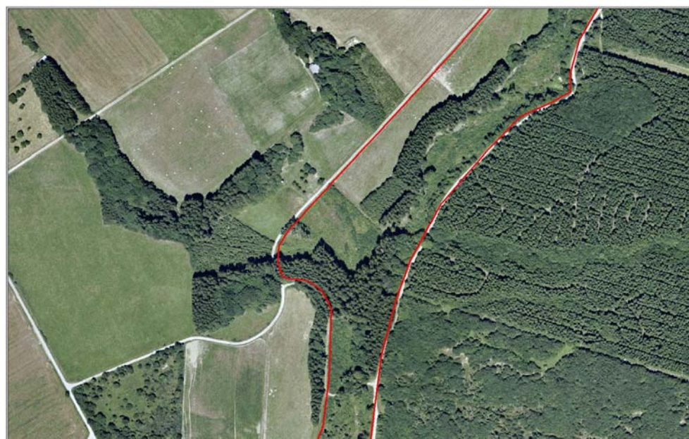
Aulbach - Luftbild 2003